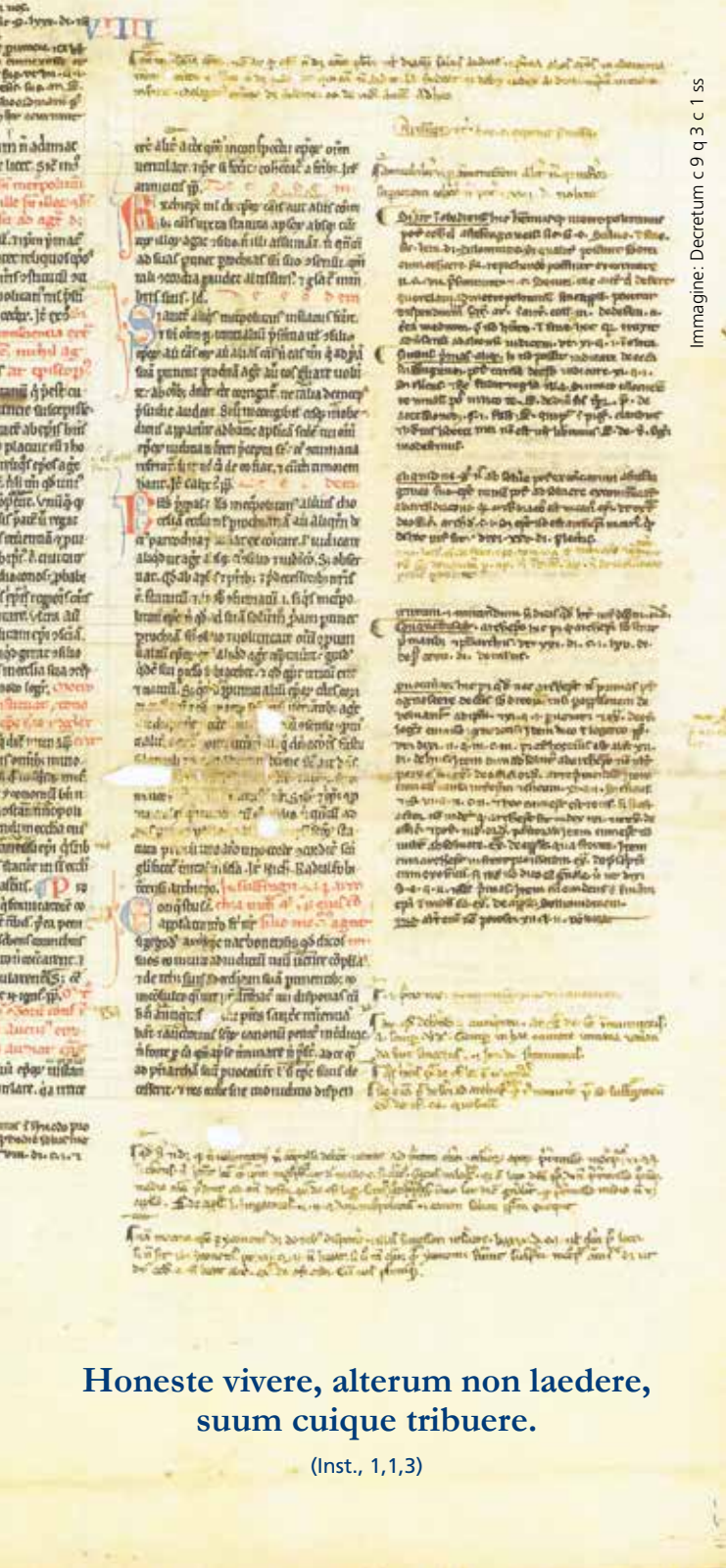
Immagine: Decretum c 9 q 3 c 1 ss

Honeste vivere, alterum non laedere, suum cuique tribuere.